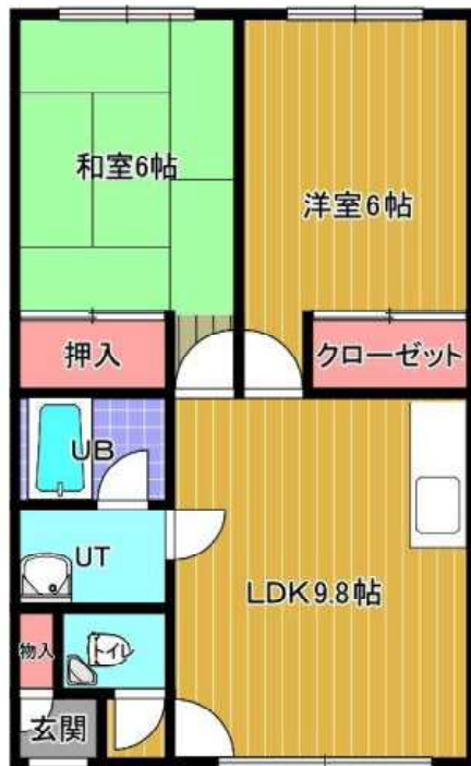
ルブルハヤシ 203号室