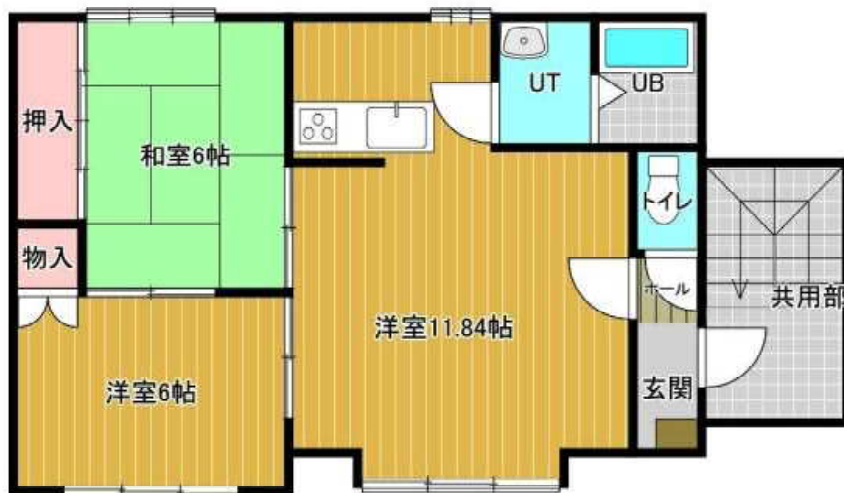
サンヒル5・1 3号室 2階 左手 2LDK 54.17㎡