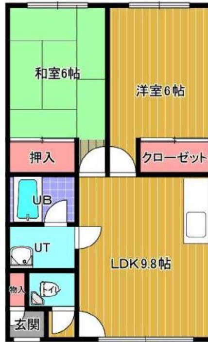
ルポールハヤシ 203号室